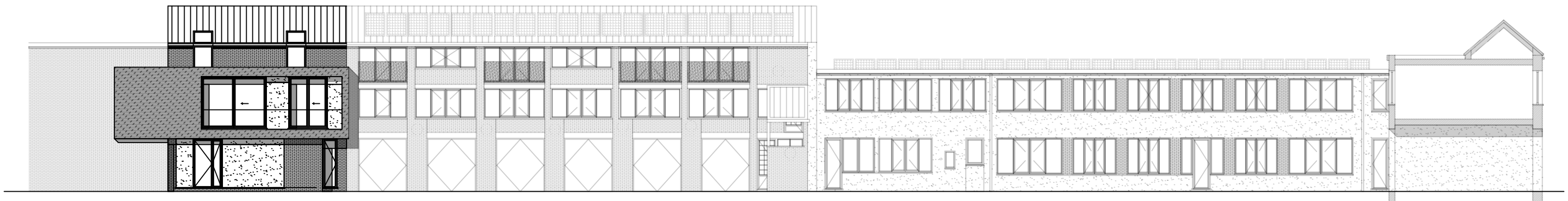
Elévation façade intérieure Nord-Ouest