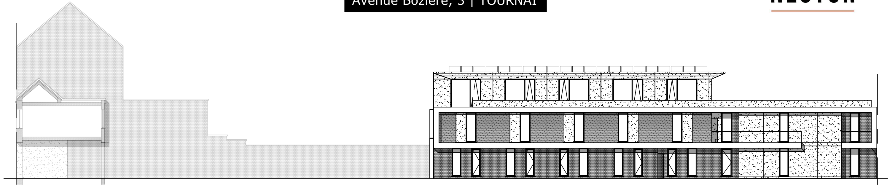
Elévation façade intérieure Sud-Est